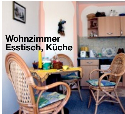
Wohnzimmer Esstisch, Küche

1 Schlafzimmer (Bettwäsche wird gestellt), 1 Wohnzimmer mit Ess-Ecke und Küchenzeile, voll ausgestattet Bad mit Dusche (Handtüchern werden gestellt) sonnige Terrasse und Garten